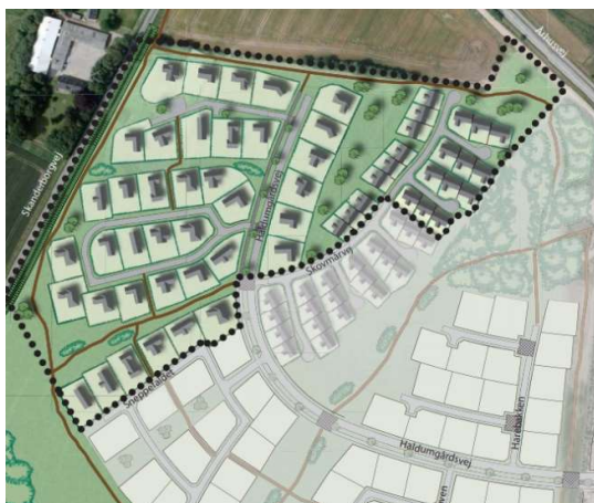
Oversigtskort fra lokalplan 365

Det har været et gennemgående tema på flere generalforsamlinger, at noget skal gøres for at reducere hastigheden og øge sikkerheden for brugere af området – og med det fremtidige antal brugere og distance der køres er der risiko for at problemet vil vokse yderligere.