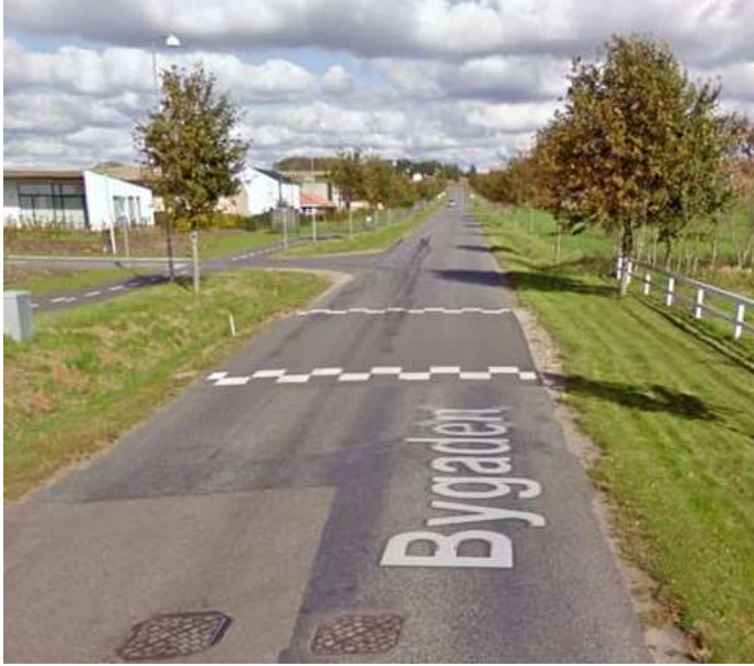
Eksempel på cirkelbump