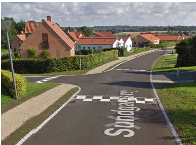
Eksempel på hævet flade med skaktern